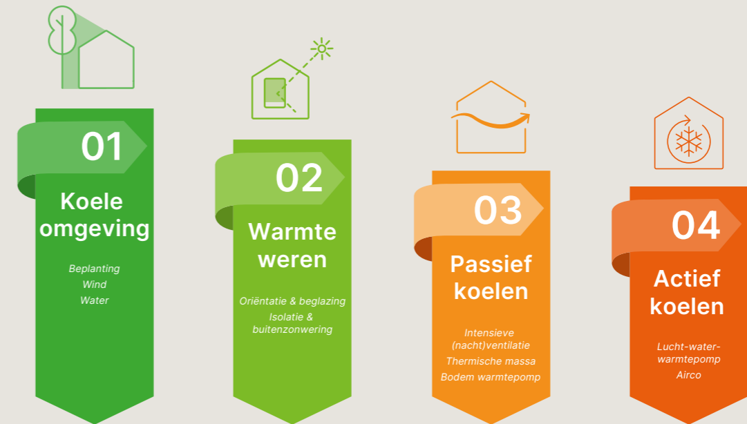
Gebaseerd op de 'ladder van koeling' van OSKA (overleg standaarden klimaatadaptatie Nederland)

Het komt er dus in de eerste plaats op aan te vermijden dat het tijdens de volgende hete periode opnieuw te warm wordt in huis. Dat vraagt om een doordachte aanpak en maatregelen die ook op lange termijn soelaas brengen. Het Nederlandse OSKA (Overleg Standaarden Klimaatadaptatie) stelde de Ladder van Koeling op, een duidelijk leidraad voor een duurzame, structurele aanpak van de oververhittingsproblematiek in gebouwen. Ze stellen preventie voorop en hanteren vier stappen (dr. Shady Attia voegde een vijfde toe, nvdr.), waarvan het vooral belangrijk is om die in chronologische volgorde te doorlopen: