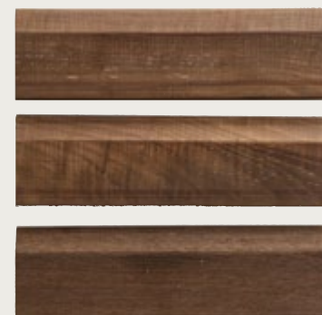
passage du rabot