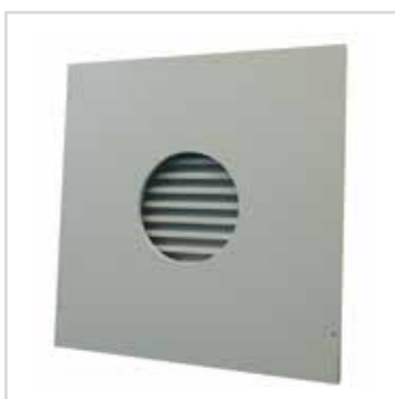
411 mit Sandwichpaneel